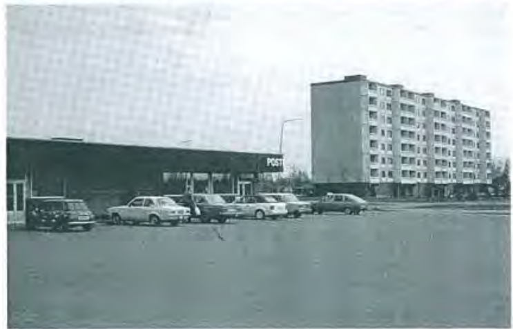
6, 7 Kaksi asuinalueita, joilla erilaiset edellytykset synnyttää territoriaalinen side.

Järjestysongelmien keskeisyys tuli korostuneesti ilmi edellä mainitussa 30 amerikkalaista kaupunkialuetta koskevassa Skoganin tutkimuksessa. Paitsi alueen järjestysongelmien voimakasta yhteyttä ryöstöriskiin se osoitti, että väestön eri ikä- ja sosiaaliekonomisten ryhmien käsitykset alueen järjestyksestä ja järjestysongelmista ovat huomattavan samanlaisia. Tutkimuksen mukaan asuinalueen järjestystä koskeva arvio oli voimakkaassa yhteydessä siihen, kuinka tyytyväisiä asuinalueeseen yleensä oltiin ja kuinka pysyväksi asumista siellä suunniteltiin. Samoin se oli yhteydessä valmiuteen auttaa naapureita.