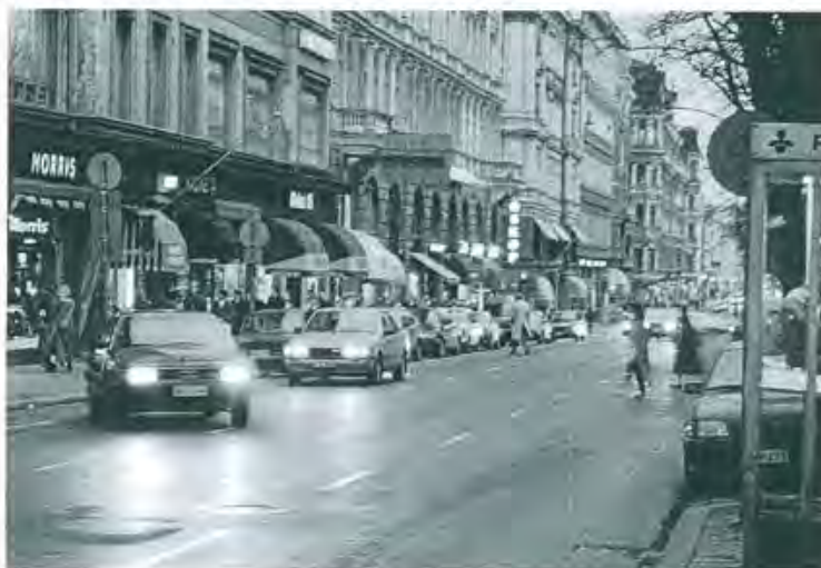
15 Toimivaa ja turvallista kaupunkikeskustaa Helsingissä.

Merkittävä yksityiskohta on kaupunkikeskustan iltaisin valaistut näyteikkunat. Ne edistävät ihmisten liikkumista kadulla myös liikkeiden sulkeuduttua. Jalankulkija välttää katua, jota reunustavat pimeät viristorakennukset puhumattakaan ikkunattomista muureista. Tanskalaisuuksituksissa korostetaan valaistujen