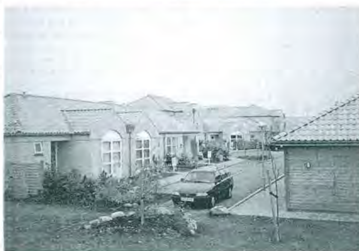
11, 12 Tanskalainen Egebjerggård on uusi asuinalue, jonka suunnittelussa on erityisesti painotettu turvallisuutta.