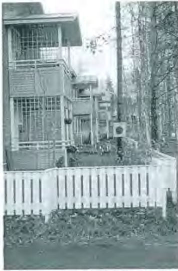
2, 3 Ailojen käyttöä rajaamaan tilan luonnetta Suomessa...