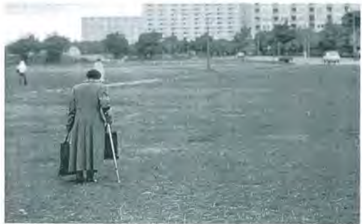
14 Massiiviset kerrostalot, pitkät etäisyydet ja autio ulkotila.

Jälkimmäinen kaupunkirakenteen tyyppi on viime aikoina saanut lisääntyvää kannatusta mm. Englannissa nk. "kaupunkikylää" markkinoivan ryhmän (The Urban Village Group) toimesta. Kaupunkikylät tarkoittavat toiminnallisesti monipuolisia paikallisyhteisöjä, jotka voivat olla joko esikaupunkeja tai sijaita suurkaupungin sisällä. Niille on ominaista inhimillinen mittakaava, joka mahdollistaa jalankulkuetäisyyksille sijoittuvat toiminnot ja toiminnallisen monipuolisuuden siten, että kaupunkikylän sisällä on mahdollisuus työntekoon, ostoksiin ja virkistykseen. Samoin niille on ominaista hyvä tasapaino julkisten rakennusten, asuin- ja liikealueiden välillä.