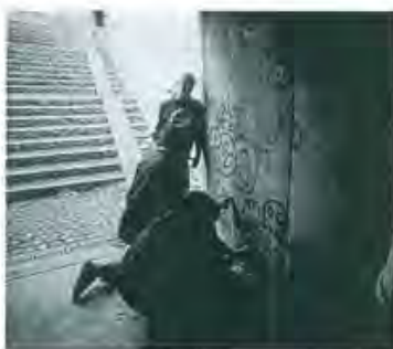
13 Tila ja materiaalit, jotka edistävät töhertelyä.

Hollannissa on havaittu sukupuolisen turvattomuudenkin olevan yhteydessä rakennettuun ympäristöön. Siellä on laadittu luettelo seikoista, joihin naisten turvallisuuden lisäämiseksi pitäisi kiinnittää huomiota. Tällaista luetteloa py-