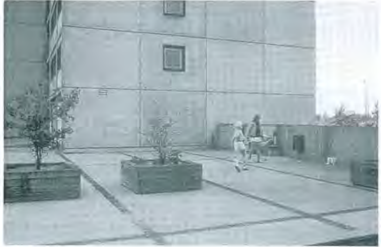
8 Kerrostalopihaa, joka ei edistä asukkaiden vuorovaikutusta.

kerran huoneistoihin liittyvä piha-alueen osan yksityiskäyttö muuttaa huoneistojen arvojärjestyksen (kun normaalisti ylimmät huoneistot ovat arvokkaimpia, ovatkin tällaisessa talossa alimmat huoneistot) ja alakerroksen huoneistojen asukkaat kiinnostuvat valvomaan talon asioita (Estrella 1988).