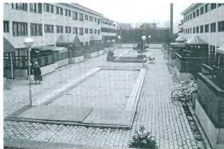
9, 10 Tästrugård ennen ja jälkeen perusparannuksen.