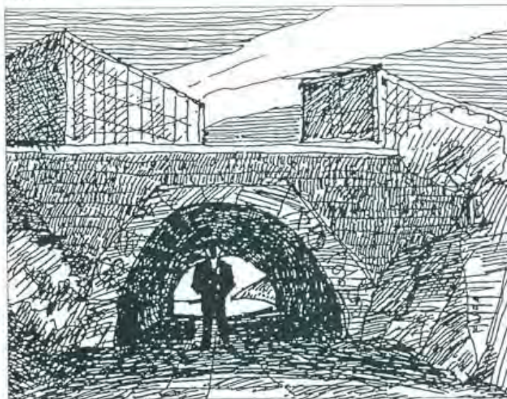
5 Fredrik Wulz: Tunneli. Pimeä ja ahdas jalankulkutunneli koetaan yleisesti pelottavaksi.

Usea tutkimus on osoittanut, että eräät tilojen ominaisuudet, kuten pimeys, tyhjiys ja umpinaisuus tai merkit epäjärjestyksestä tulkitaan pelottaviksi. Jalankulkija pelkää paikkaa, jossa näkyvyys on huono, joka tarjoaa oletetulle rikoksentekijälle paikan piiloutua ja josta hän ei voisi rikoksen uhrina paeta (Nasar ja Fisher 1993).