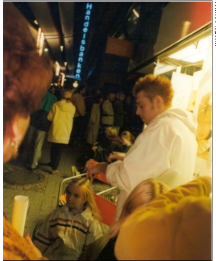
Kaupunkikeskustat sykkivät elämää vuorokaudet läpeensä.

– Kävelykadun kunto vaikuttaa sekin rikollisuuden määrään. Siisteys ja valaistus luovat turvallisuutta ja ovat myös yksi halvimmista keinoista vaikuttaa turvallisuuteen. Kun kiinteistönomistajat