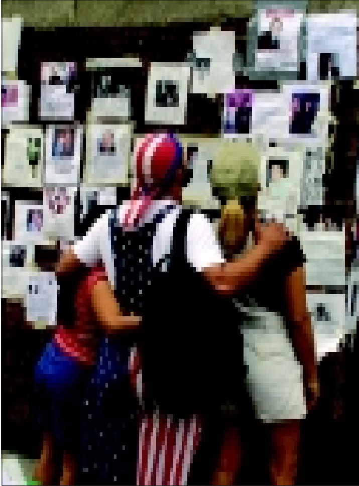
Pian sen jälkeen kun ensijärkytys oli ohi, osavaltioiden ja liittovaltion lainsäätäjät esittivät uusia toimenpiteitä sekä hyökkäyksiin syyllistyneiden saamiseksi tuomittaviksi että uusien terrori-iskujen ehkäisemiseksi.

ehdotukset siirtävät huomiota syytetyn oikeuksien turvaamisesta siihen, että julkisella vallalla on oltava mahdollisuudet halpaan ja nopeaan rikosasioiden käsittelyyn.