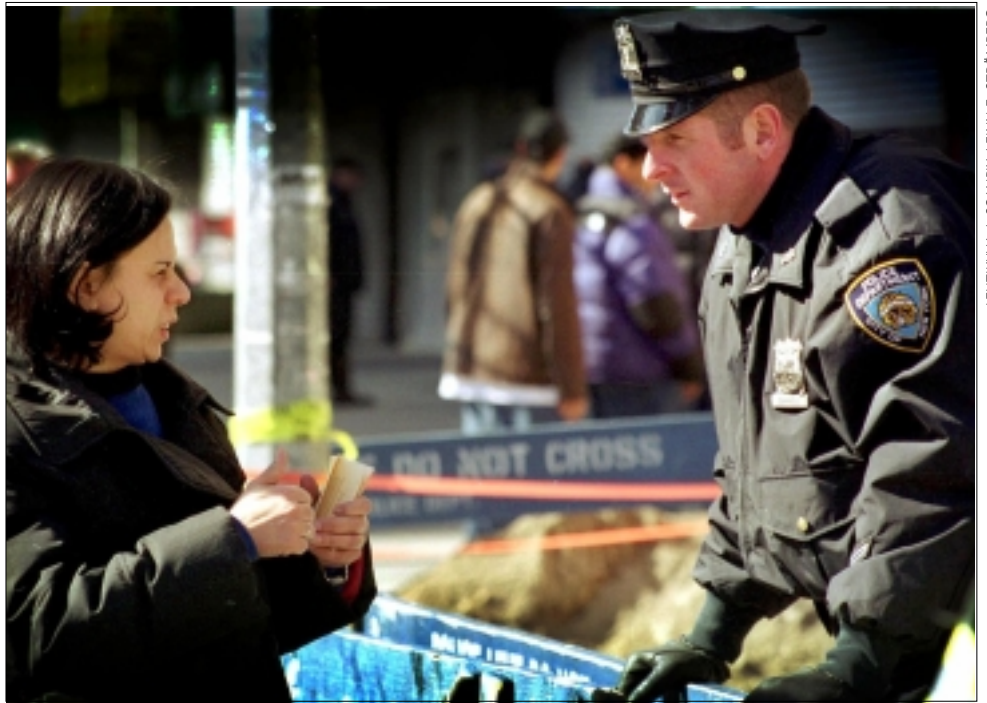
Nollatoleranssin näkyvin seuraus New Yorkin rikostilastoissa on rikepidätysten räjähdysmäinen kasvu.