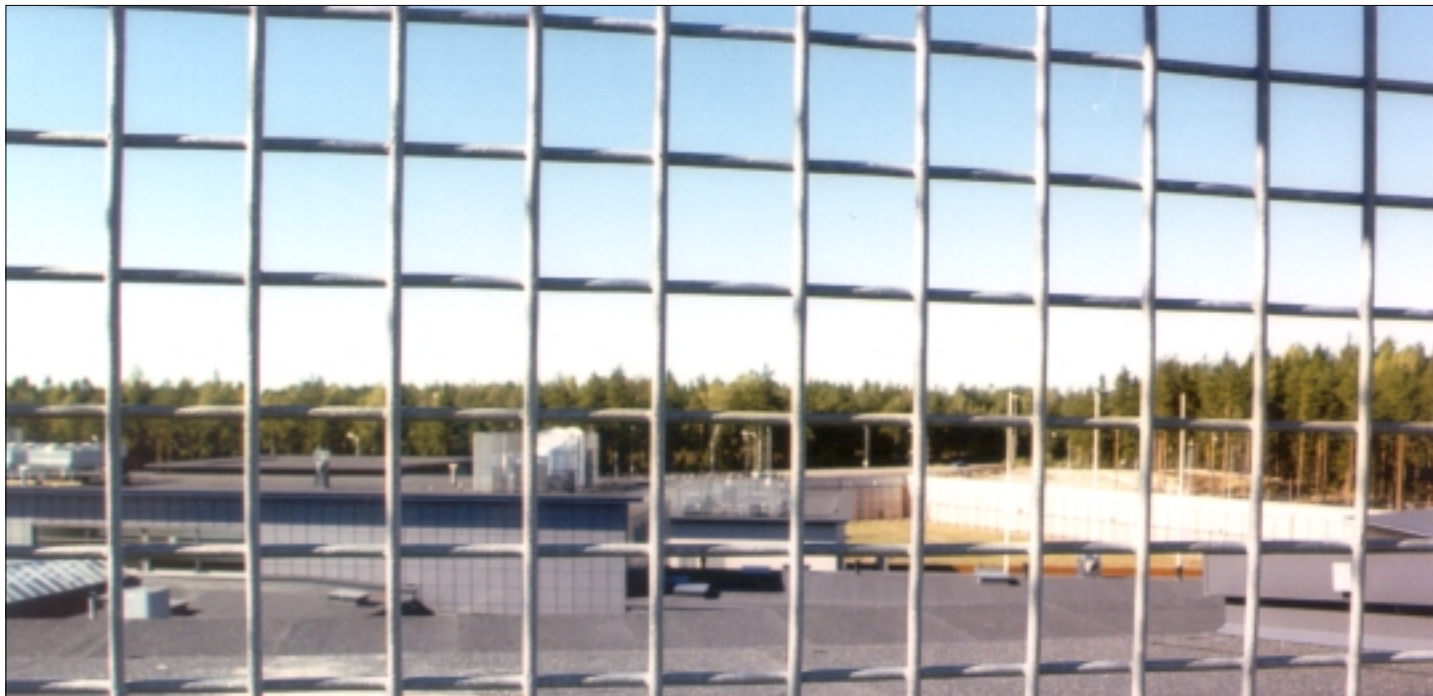
Ruotsissa keskustellaan yksilöllisemmästä vankilasta vapautumisajankohdasta.