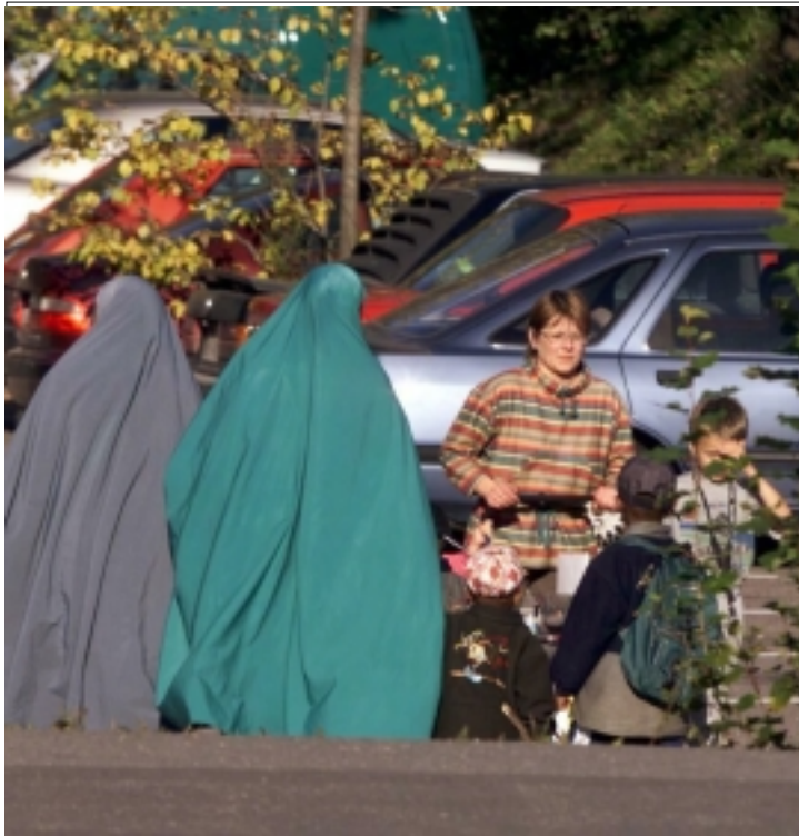
Sovittelun avulla halutaan lisätä suvaitsevaisuutta ja ymmärtämystä erilaisista kulttuuri- ja uskontoista tulevien ihmisten välillä.

joskin täytyy muistaa, että tähän vaikuttavat muutkin tekijät, mm. maahanmuuttajien kotoutumisen edistyminen Suomessa.