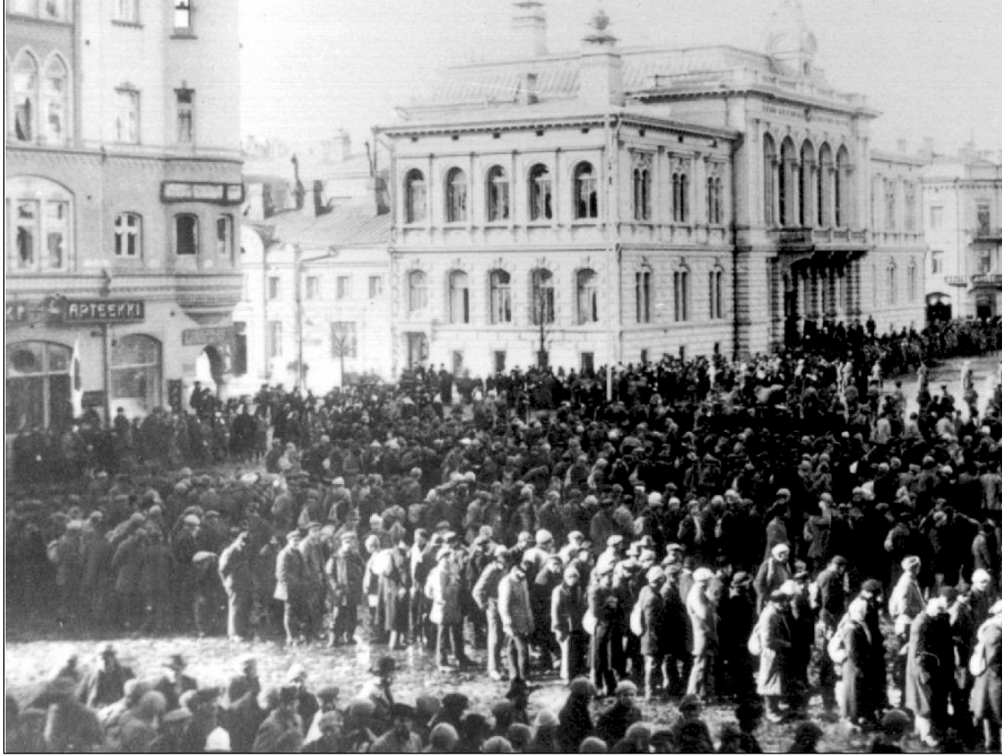
Tampereen punaiset koottiin kaupungin valtauksen jälkeen Keskustorille odottamaan kuljetusta eteenpäin.