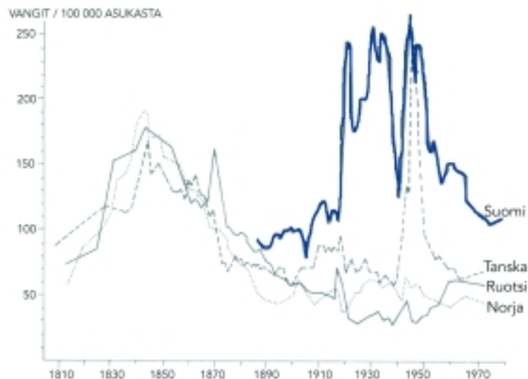
Vankilukuja Pohjoismaissa 1810–1970. Lähde: Nils Christie 1968.