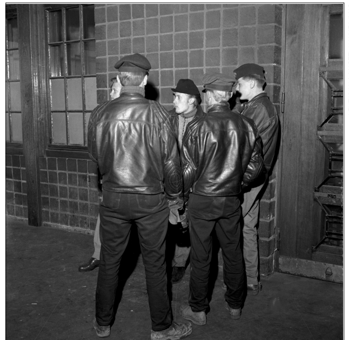
Toisen maailmansodan jälkeen puhuttiin häiriintyneistä, sopeutumattomista ja nuorista lainrikkojista. Kuvassa nuoria Helsingin rautatieasemalla 1950-luvulla.

Itsenäistymisen jälkeen lapsiväestö ymmärrettiin yhä selvemmin nuoren kansakun-