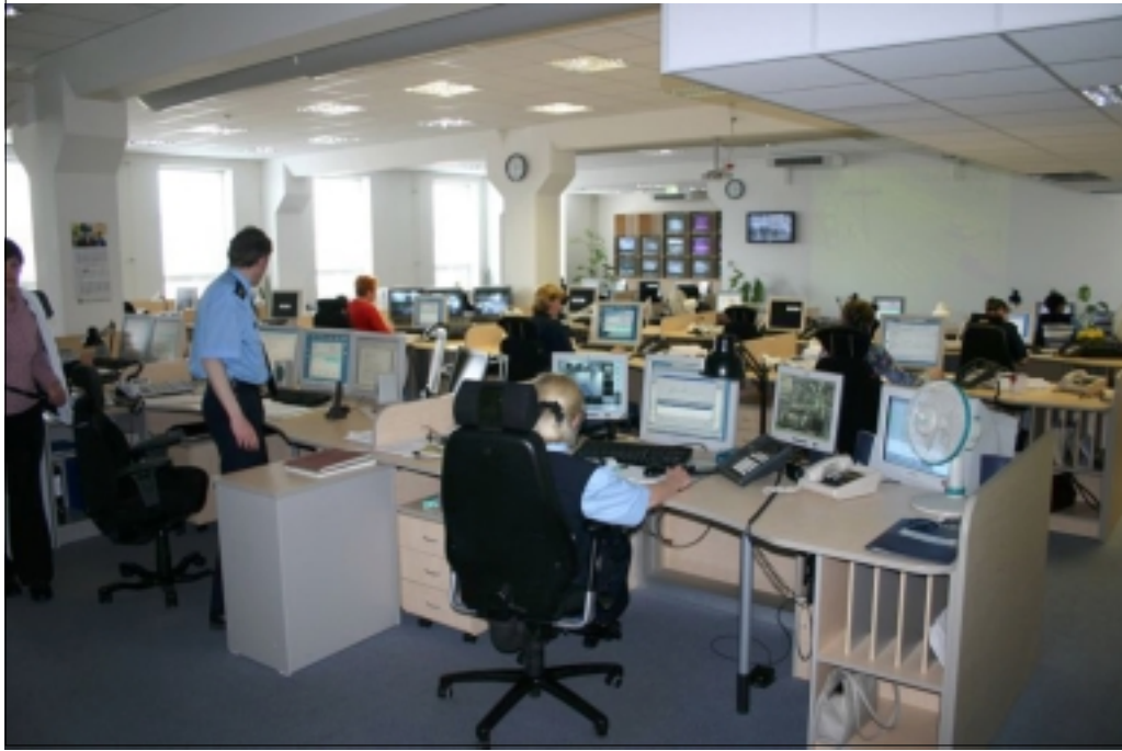
Tallinnan keskustan pohjoisen poliisipiirin johtamiskeskus. Sinne tulevat kaikki piirin alueelta hätänumeroon 110 soitetut puhelut ja siellä seurataan myös kaikkia alueen turvakameroita.