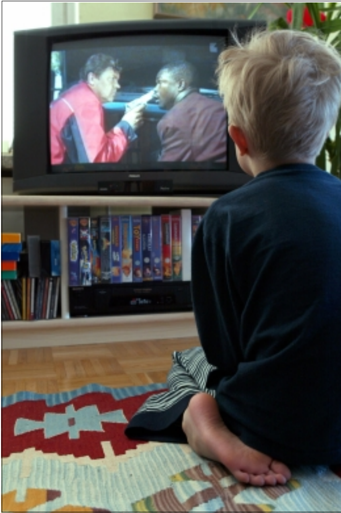
Ohjelmaehdotuksessa todetaan, että väkivaltaisen viihteen vaikutus lapsen käyttäytymiseen ei ole yleisellä tasolla suuri, mutta riskiryhmässä sillä on merkitystä.

kyistä johdonmukaisempaa poistamista poliisin väkivaltaisiksi ja alkoholisoituneiksi tietämiltä henkilöiltä. Poliisin pitäisi myös ottaa ainakin tällaisten henkilöiden esittämät tappouhkaukset vakavasti ja ryhtyä uhattua suojaaviin toimiin.