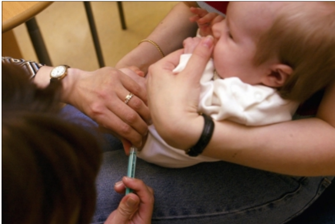
Äitiys- ja lastenneurolat ovat keskeisiä palveluja parisuhdeväkivallan tunnistamisessa ja puheeksi ottamisessa.

→ roidun lomakkeen avulla raskaana olevia naisia ja pienten lasten äitejä kahden kesken. Äitien nuorin lapsi oli molemmissa tutkimuksissa haastatteluhetkellä korkeintaan yhden vuoden ikäinen.