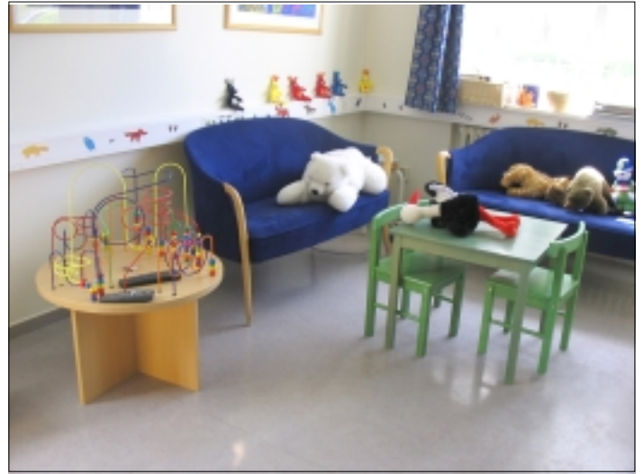
Talo on sisustettu kodikkaasti lasten mieleiseksi.

on saada lapselta itseltään niin tyydyttävä ja tarkka selonteko tapahtumien kulusta kuin mahdollista.