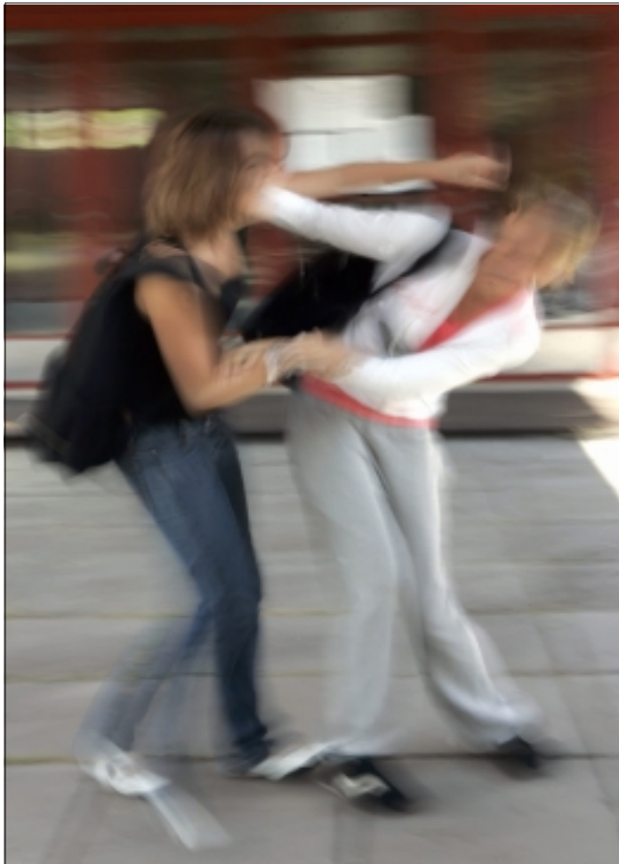
Väkivallan tulkitseminen välineeksi oli sekä tyttöjen että poikien tapa puhua sellaisesta väkivallasta, joka oli heidän mielestään oikeutettua.

Tytöt puhuivat omista väkivaltakokemuksistaan lähes yksinomaan ryhmissä, joissa oli