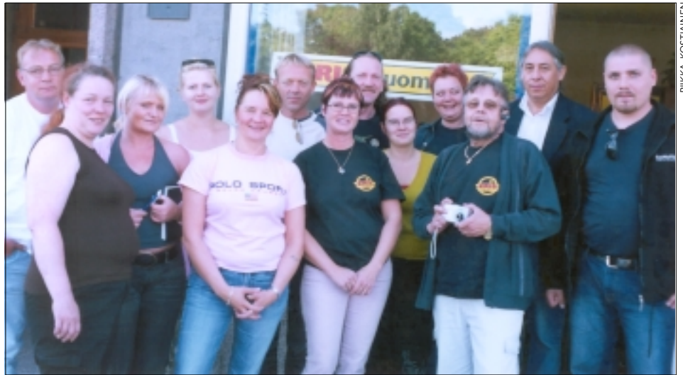
Elokuussa KRISin Helsingin toimistolla kävi pohjoismaisia vieraita. Yhteistyösuhteet muiden maiden yhdistysten kanssa ovat tiiviit.

KRISin omien tilastojen mukaan tähän mennessä portilta on haettu 40 vapautuvaa ja kaikkiaan tuettu 79 henkilöä. Noin kolmen kanssa neljästä on onnistuttu joko päihdeettömyyden, rikoksettomuuden tai molempien suh-