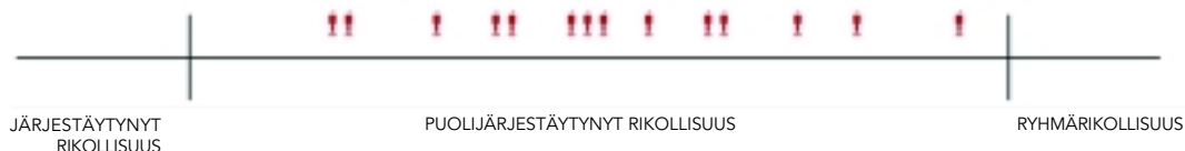
Kuvio 1. Tutkitut 14 suomalaista ryhmää järjestäytyneen ja ryhmärikollisuuden janalla.

→ läpittäminen ei ollut edes tavoite, koska toimintaa ei ollut suunniteltu pitkäaikaiseksi eikä tavaran saatavuutta haluttu tai voitukaan taata. Käyttäjryhmien monopoli-soimisen suurin ongelma on, että narkomaanille tai prostituution käyttäjälle on aivan sama, kuka tuotteen myy, kunhan sitä on saatavilla. Varastetun tavaran kohdalla