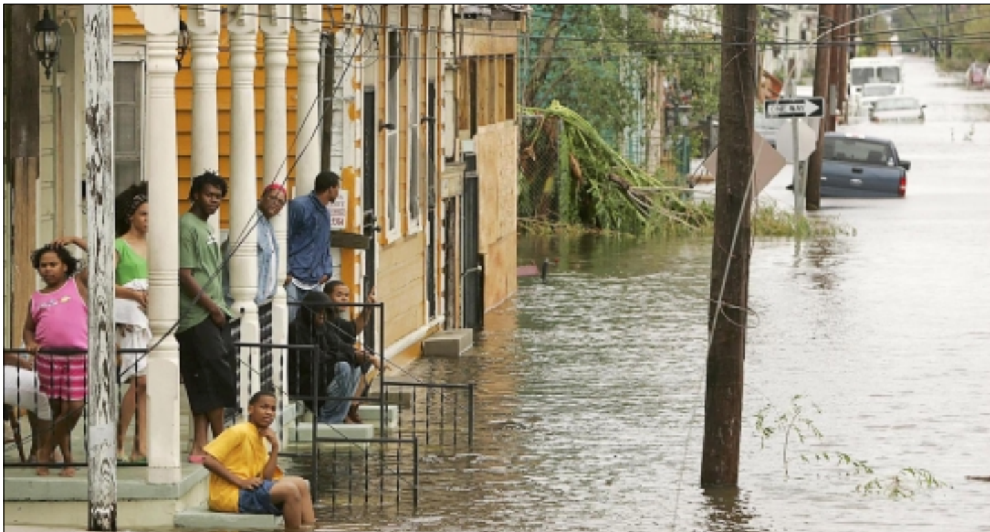
New Orleansin tulvaa viime syksynä. Värkauksien pelko on yksi syy siihen, etteivät uhrin evakuoitikehotuksesta huolimatta aina poistu katastrofialueelta.