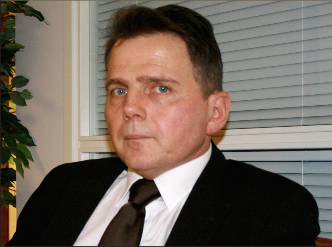
Poliisipäällikkö Lasse Aapion mielestä tarvitaan malleja, joissa viranomaiset tekevät yhdessä työtä eivätkä pelkästään yhteistyötä.

rikksentorjuntaneuvoston ylläpitämä tietopankki ja pian käyttöön otettava VTT:n ARTU-ohjelma mm. uhkianalyysien tekoon.