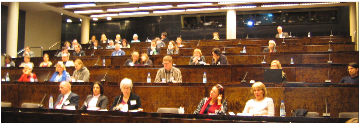
Sovittelijoita, oikeushallinnon virkamiehiä ja tutkijoita eri Pohjoismaista osallistui marraskuussa rikossovitteluseminaariin Helsingissä. Kuva on eduskunnan auditoriosta.