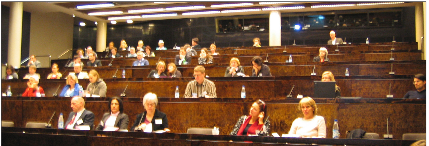
Sovittelijoita, oikeushallinnon virkamiehiä ja tutkijoita eri Pohjoismaista osallistui marraskuussa rikossovitteluseminaariin Helsingissä. Kuva on eduskunnan auditoriosta.