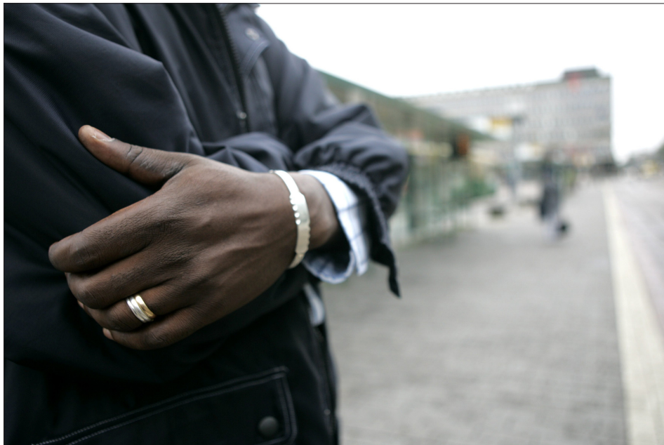
Maahanmuuttajien määrä on kaksinkertaistunut Suomessa kymmenessä vuodessa.

→ ei ole selkeää suuntaa: Turussa oli nousua 2007, mutta se on tahtunut 2008. Toisaalta esimerkiksi Helsingissä määrä on laskenut vuodesta 2005, kun taas vuonna 2008 tulee selkeää nousua. Yhden vuoden nousupiikki ei tee vielä trendiä. On lisäksi huomattava, että maahanmuuttajien määrä on kaksinkertaistunut 1999–2008 ja kasvanut aivan erityisesti isoissa kaupungeissa.