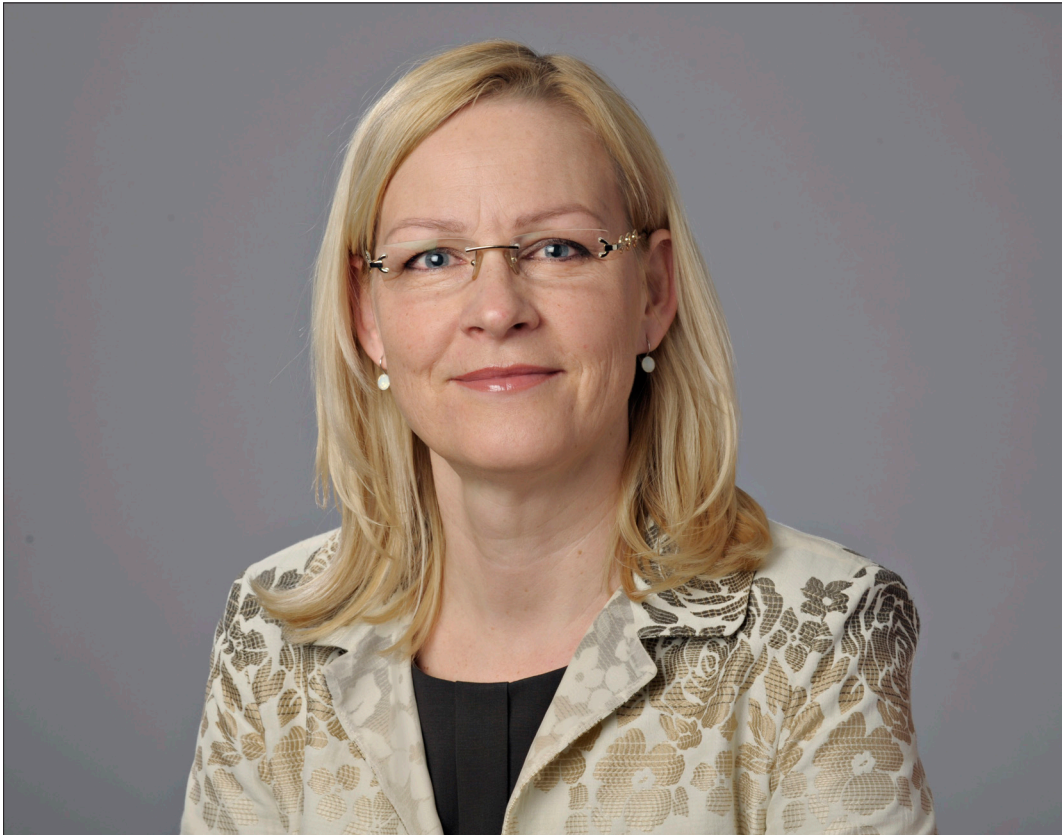
Vähemmistövaltuutettu Eva Biaudet pitää pahimpana syrjintänä sitä, kun ulkomaalainen joutuu Suomessa vakavan rikoksen uhriksi.

tuttu silloin kun poliisi ja tuomioistuin ovat tukeneet uhrin oikeuksien vahvistamista. Kun uhri tuntee, että hänellä on todellisia vaihtoehtoja hyväksikäytölle ja hänelle annetaan aikaa palautua ja mahdollisuus rakentaa omaa elämäänsä, hän mielellään usein myöskin tukee esitutkintaa. Rikosprosessi ja uhrin asema eivät ole vastakkaisia tavoitteita. Niin lainsäädäntömme, kansainväliset sopimukset ja kansallinen toimintasuunnitelmamme edellyttävät uhrilähtöistä ja ihmisoikeuslähtöistä toimintatapaa, mutta haaste on, mitä se käytännössä tarkoittaa.