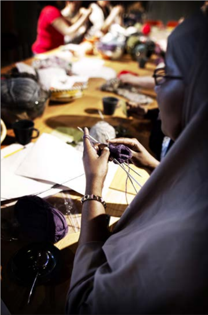
Helsingin seudulla syrjäytyminen sekä rasismien ja ulkopuolisuuden kokemukset ovat tyypillisiä esiin nousevia teemoja.

että ootko sä äärimuslimi? Se ei saanut yöllä nukkuttua sitä, että mä tulín sen mieleen, kun sanottiin äärimuslimi, niin hän alkoi miettiä, että herranen aika, xxx rukoilee, onkohan se xxx sitten? Sitten kun mä aina välillä sanon, että mä olin moskeijassa, niin sitten tuli pelko, että voi ei.”