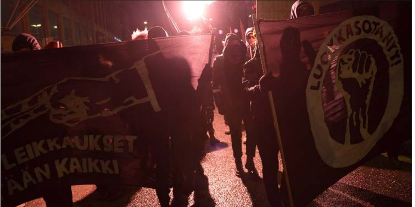
Kuvassa vasemmistoanarkistien Luokkaretki lähiöst linnan -mielenosoitus itsenäisyyspäivänä 2014.